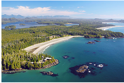
Middle Beach Lodge - Tofino