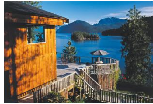
West Coast Wilderness Lodge