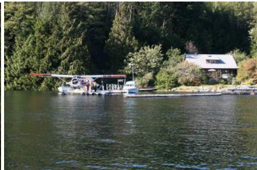
Knight Inlet Lodge