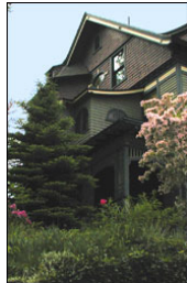
B&B The Hill Victoria