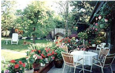
B&B European Vancouver