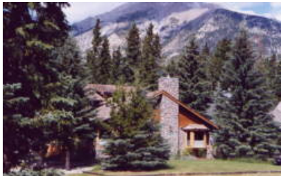
Pension Amble Inn