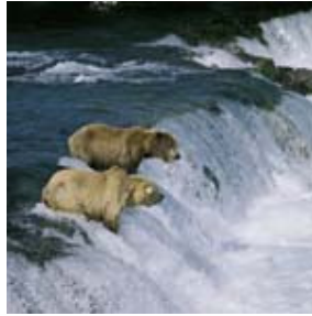
Bären beim Lachsfischen