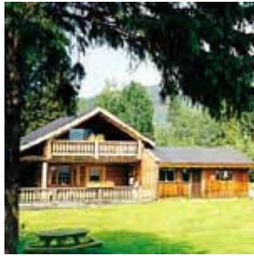
Nakiska Ranch Clearwater