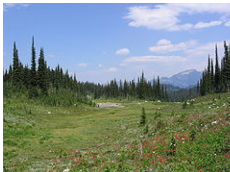
Mount Revelstoke Nationalpark