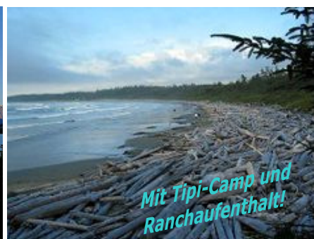
Pacific Rim National Park