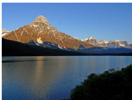
Clearwater Banff Nationalpark