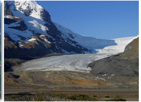
Icefield in Jasper