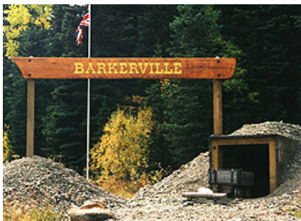
Barkerville – alte Goldgräberstadt