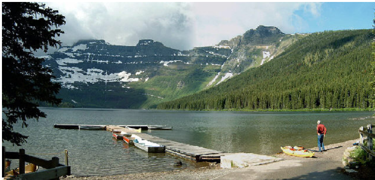
Waterton Park am Waterlake