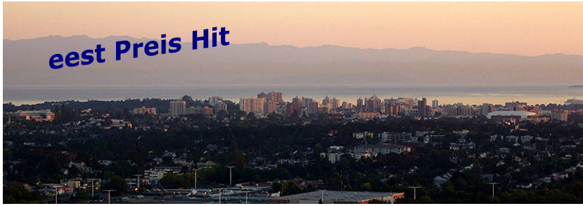
Victoria British Columbia