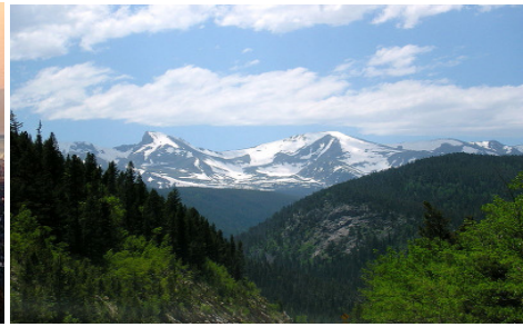
Rocky Mountains Colorado