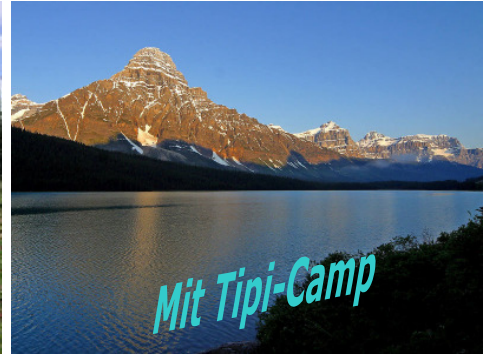
Pacific Rim National Park