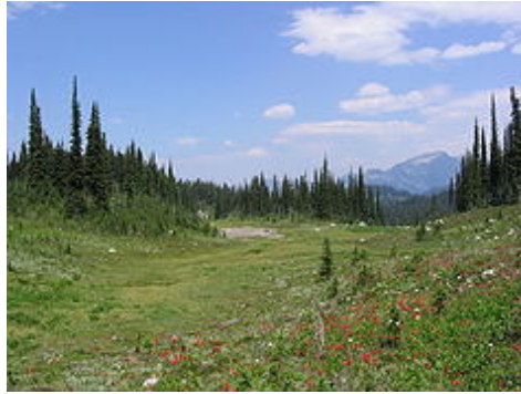
Mount Revelstoke Nationalpark