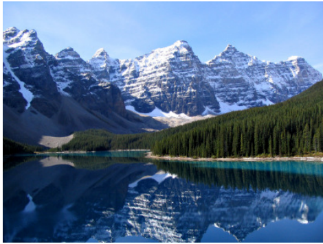
Lake Moraine Tal