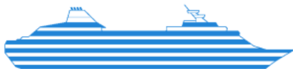
Deckpläne ( Acrobat PDF )

INNENKABINE Kategorien: I, JJ, J, K, L, M, N. Günstig und komfortabel, mit allen wichtigen Einrichtungen. 2 untere Betten und elegantes Interieur.