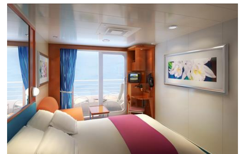
Beispiel: Außenkabine mit Balkon