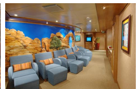
SPA Santa Fe