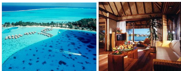
Intercontinental Moana BOB Lagoon Überwasser BGL

Transfer Flughafen Moorea , Flug nach Bora Bora und Transfer zum Intercontinental Moana Bora Bora . 6 Nächte im DZ Lagun Überwasser Bungalow. Luxus Traumhotel direkt am Matira Point mit Blick auf die türkisfarbene Lagune. Inklusive Frühstück Buffet.