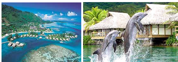
Intercontinental Moorea Überwasser Bungalow

Transfer zum nationalen Flughafen Papeete. Inlandflug mit Air Tahiti nach Moorea und Transfer zur Intercontinental Moorea Resort . Luxus Hotel direkt am Pazifik und der Lagune in einer herrlichen Anlage. 6 Nächte im DZ Überwasser Bungalow. Inklusive Frühstück Buffet.