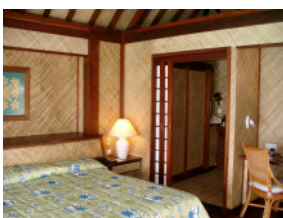
Zimmerbeispiel Garten Blick