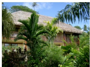
Le Maitai Polynesia