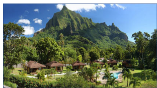
Pension Village Temanoha