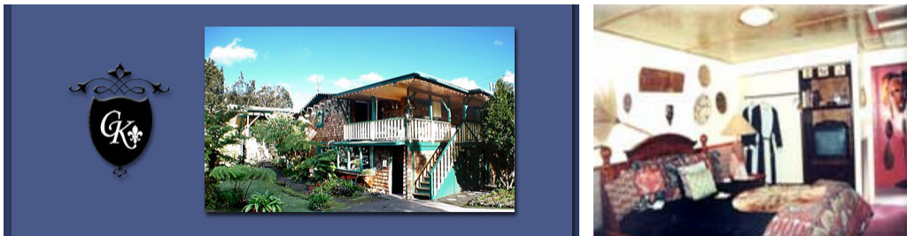
The Inn at Volcano