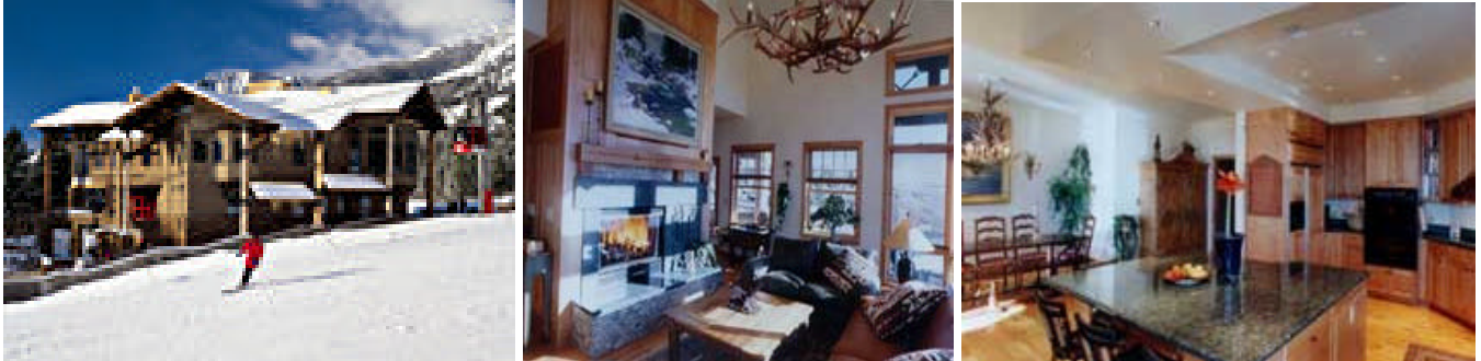
Gemütliche Ferienwohnungen mit besten Komfort

Beispiel Beschreibung und Bilder: (Vorbehaltlich Änderungen durch das Unterkunfts- Management).