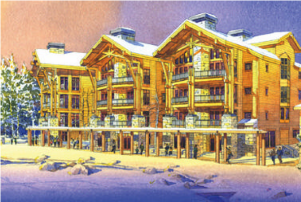
Gemütliche Ferienwohnungen mit besten Komfort

Beispiel Beschreibung und Bilder: (Vorbehaltlich Änderungen durch das Unterkunfts- Management).