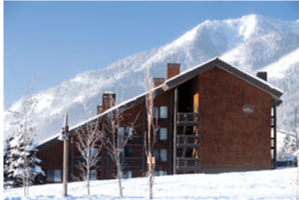
Gemütliche Hotelzimmer mit besten Komfort

Hotel Best Western Lodge, Hotel direkt an der Piste & Nähe Lift